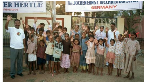
2002: Die ersten Besucher aus Deutschland und Gruppenphoto vor der Kinderarche