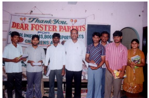
Die Schüler aller Altersstufen werden mit neuen Unterrichtsmaterialien versorgt

Mit Hilfe des neuen Beamers dürfen sich die Kinder gelegentlich an einem Filmabend erfreuen. Gerade jetzt ist das für die neu aufgenommenen Kinder eine gute Ablenkung vom Heimweh.