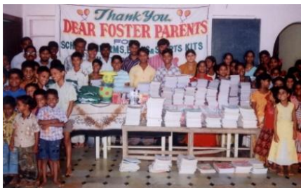
Zum Schuljahresbeginn liegen die neuen Bücher bereit