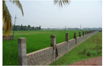
Die Mauer steckt die Grenzen ab

• 2009: Im Frühjahr beginnen endlich die Bauarbeiten für unser eigenes Kinderarchengebäude: Nachdem die letzte Reisernte eingefahren ist, wird zunächst eine stabile Umgrenzungsmauer um unser Grundstück errichtet. Der nächste Schritt muss nun sein, das Gelände aufzufüllen und gut zu befestigen, sodass es höher als die umliegenden Felder liegt und sich dem Niveau der vorbeiführenden Straße annähert. In der Kinderarche leben inzwischen 75 Kinder, dazu kommen 14 Tageskinder aus der Nachbarschaft.