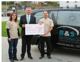
Bei der Scheckübergabe

So schwierig sich der Bau vor Ort gestaltet, so gut ist unser Backstein-Sponsoring in Deutschland angelaufen. An dieser Stelle möchten wir uns ganz herzlich für alle bisher eingegangenen „Backstein“-Spenden bedanken!!! Seit Beginn dieser Aktion im Juli konnten wir uns über Spenden von insgesamt 16.375 symbolischen „Backsteinen“ im Wert von je 1€ freuen. Das heißt rund ein Drittel der noch fehlenden Gelder ist mittlerweile zusammen gekommen. Allen Spendern hierfür ein herzliches Dankeschön!!! Beispielhaft möchten wir uns bei B&S Service GmbH bedanken. Die Firma mit Sitz in Waldangelloch spendete 4000 Backsteine!