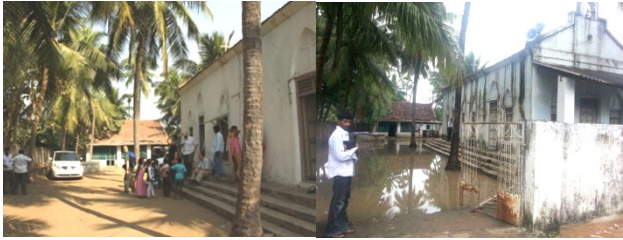
Links und Mitte: Die Kirche in Rajavaram im Februar und November 2012. Rechts: Die Kirche in Kesavaram ist nun einsturzgefährdet!

schwierige Zeit, abgesehen von den üblichen Fiebererkrankungen, gut überstanden haben!