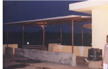
Die neue Überdachung vor der Küche

von November bis März war dies auch kein Problem, danach jedoch wären die Kinder beim Essen zunächst der Hitze des Sommers und anschließend dem sintflutartigen Monsunregen schutzlos ausgeliefert gewesen. Deshalb wurde jetzt ein Teil der Terrasse überdacht – der Platz darunter bietet nun bis zu 50 Kindern Schutz vor Sonne und Regen bei den Mahlzeiten. Die Kosten hierfür beliefen sich auf ca. 800 US-$. Der Betrag liegt etwas höher als ursprünglich veranschlagt, dafür kann die Konstruktion aber bei Bedarf auch abgeschraubt und zu einer anderen Behausung mitgenommen werden (wir wohnen bislang ja nur zur Miete).