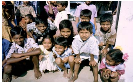
Kinder in einem indischen Dorf