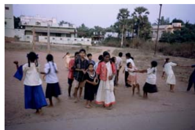
Die Kinder beim Musizieren und beim Spielen im Freien

Vielen Dank, dass Sie diese wertvolle Arbeit ermöglichen durch Ihr Interesse, Ihre finanzielle Unterstützung, Ihre Weiterempfehlung und Ihr Gebet! Mit Ihren Fragen und Anregungen können Sie sich jederzeit über die angegebenen Kontaktmöglichkeiten an uns wenden.