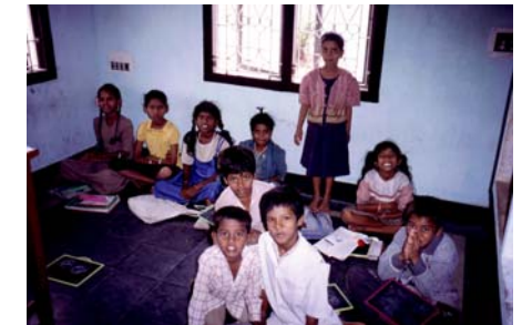
Unterricht in der Kinderarche

In der nächsten Zeit möchten wir mit einem weiteren Bauprojekt einem großen Mangel abhelfen: Es gibt bisher für alle Kinder nur eine Toilette und einen Waschraum! Ein Teil der Kids marschiert deshalb morgens und abends zu Pauls Privathaus, um sich dort zu waschen. Je mehr Kinder es aber werden, desto unhaltbarer wird dieser Zustand. Deshalb sollen für ca. 1000 US-$ vier zusätzliche Sanitärräume angebaut werden.