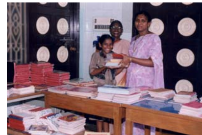
Neue Schulbücher und Bibeln zum Beginn des Schuljahres!

Die Eingewöhnung von Kindern, die bisher auf der Straße gelebt haben, in ein geordnetes Leben und Lernen ist alles andere als einfach. Der Gang zur Toilette, der geregelte Tagesablauf, ein gewisses Maß an Disziplin – all diese Dinge haben sie bislang noch nicht kennen gelernt, und so gibt es gerade in der Anfangszeit für Kinder und Mitarbeiter so manch unruhigen Tag und schlaflose Nacht! Blickt man einige Zeit später jedoch auf die Frucht dieser Mühen, dann kann man nur sagen: Es lohnt sich!!