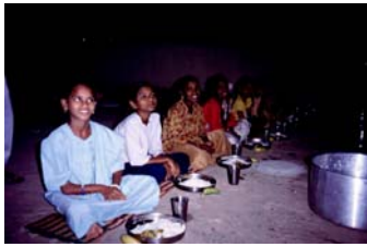
Nachmahlzeit auf der Dachterrasse

von November bis März war dies auch kein Problem, danach jedoch wären die Kinder beim Essen zunächst der Hitze des Sommers und anschließend dem sintflutartigen Monsunregen schutzlos ausgeliefert gewesen. Deshalb wurde jetzt ein Teil der Terrasse überdacht – der Platz darunter bietet nun bis zu 50 Kindern Schutz vor Sonne und Regen bei den Mahlzeiten. Die Kosten hierfür beliefen sich auf ca. 800 US-$. Der Betrag liegt etwas höher als ursprünglich veranschlagt, dafür kann die Konstruktion aber bei Bedarf auch abgeschraubt und zu einer anderen Behausung mitgenommen werden (wir wohnen bislang ja nur zur Miete).